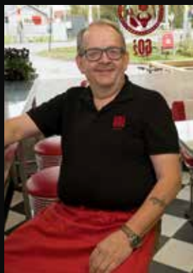
Raymonds Diner, Rakkestad

Alle drivere har opplevd mer enn 20% omsetningsvekst!