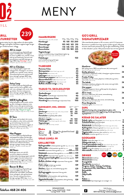
Menyplakat, 50 x 70 cm: