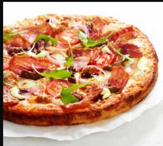
Pizzakonseptet vårt er valgfritt å ha med, men du vil garantert ikke agre! Bilde over: Meatlover.