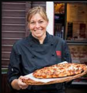
Patricias Gatekjøkken, Bardu