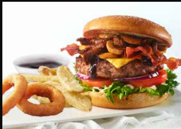
De 4 signaturburgerne våre må du ha med på menyen. Over: En All-In Meat med tilbehør

Gode råvarer + fornøyde kunder + gode systemer = stolte ansatte